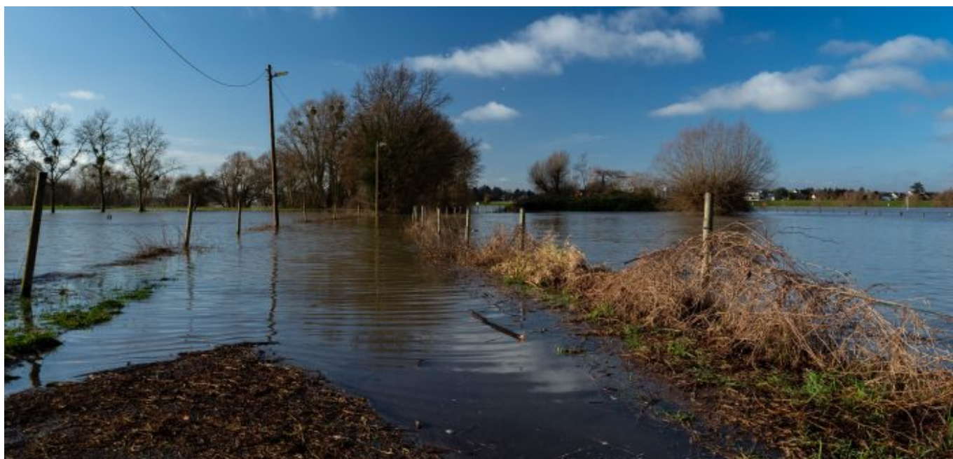
Winter 2021 – erst kam das Hochwasser in den Himmelgeister Rheinbogen...

Dabei ist die Jücht nicht nur als Naturschutzgebiet von Bedeutung, sondern muss als naturhistorisches Denkmal betrachtet werden, nämlich als herausragendes Beispiel für die Rheinauen, die früher die Landschaft am Niederrhein prägten. Mit einem rückverlegten Deich könnte sich die Gegend analog zur Urdenbacher Kämpe entwickeln: durch die erweiterte Auslauffläche würde der Hochwasserschutz gesteigert, und die Tier- und Pflanzenwelt hätte mehr Raum.