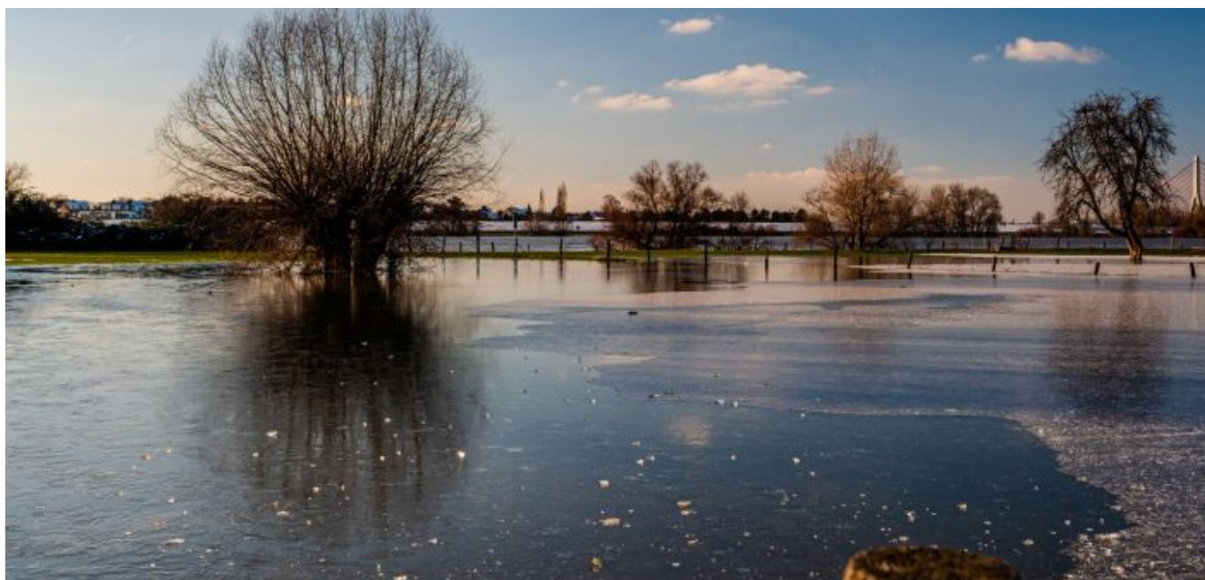
...und dann das Eis

So oder so ist die Jücht eine der schönsten Ecken der Stadt und für Spaziergänger und Radfahrer bestens erschlossen. Am Schlossmeierhof kann man parken, die offiziellen Wege sind gekennzeichnet. In der Regel steuert man zu Fuß die alte Himmelgeister Kastanie an, um dann südwärts bis zum Fluss zu gelangen, wo man sich nordwestlich hält und über den Deich zum Ausgangspunkt zurückkehrt. An zwei Stellen kommt man direkt ans Wasser, um eine Pause einzulegen und den Schiffen zuzuschauen, die auf dem Rhein an einem vorbeiziehen.