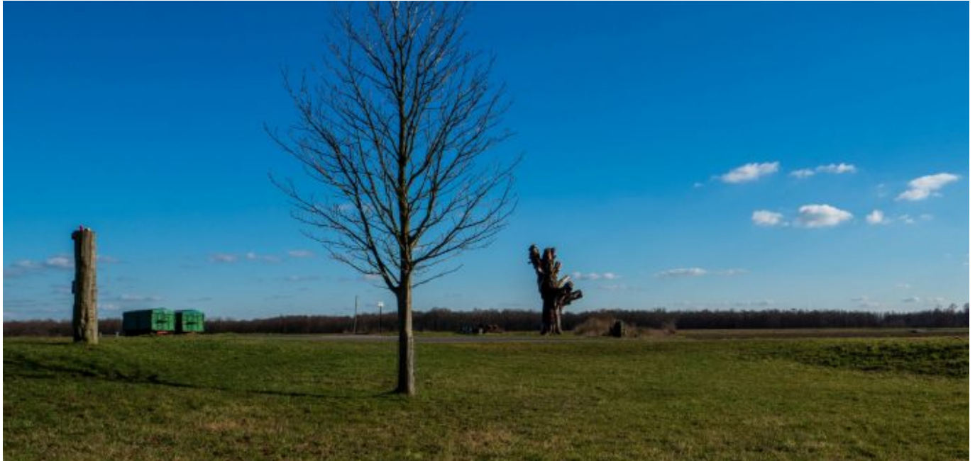
Der Stamm der berühmten Himmelgeister Kastanie und der neu gepflanzte Baum