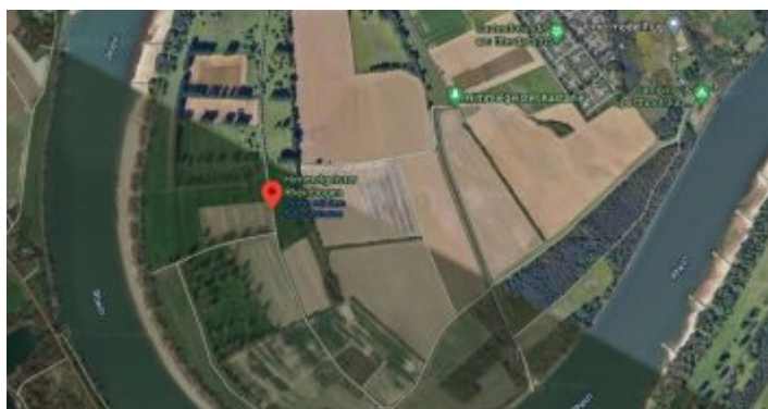
Google-Map: der Himmelgeister Rheinbogen

Unterstützt TD! Dir gefällt, was wir schreiben? Du möchtest unsere Arbeit unterstützen? Nichts leichter als das! Unterstütze uns durch das Abschließen eines Abos oder durch den Kauf einer Lesebeteiligung – und zeige damit, dass The Düsseldorfer dir etwas wert ist.