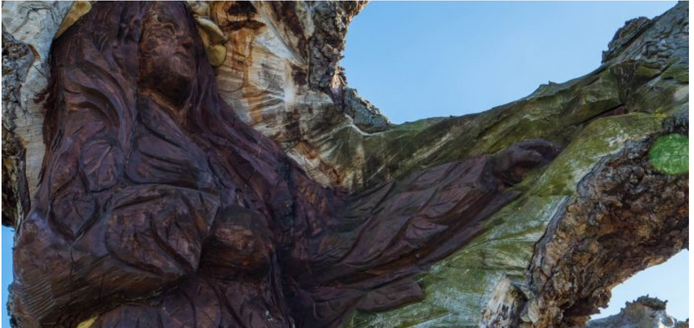
Der Baumgeist der Himmelgeister Kastanie