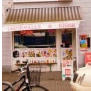
Trinkhalle & Kiosk