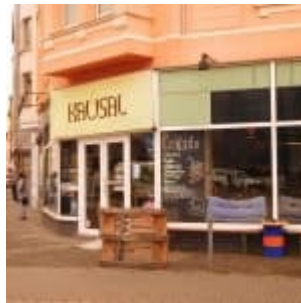
Das Kausal an der Ecke