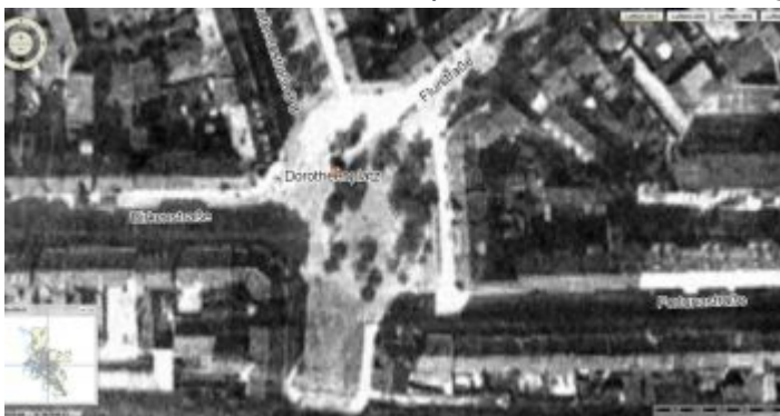
Der Dorotheenplatz 1927

Eigentlich ist es doch beruhigend, dass es in unserer kleinen Großstadt, die sich so gern aufbretzelt, noch raue und hässliche Ecken wie den Dorotheenplatz gibt. Wer dieses „Herz von Flingern-Nord“ schon seit – sagen wir – mehr als 40 Jahren kennt, kennt es nicht anders. Dabei war der Dorotheenplatz am Ende einer Allee einmal ein wirklich hübsches Fleckchen inmitten des Viertels. Aber dann kam erst die Straßenbahn (in den späten Zwanzigerjahren) und dann der Lastring. Letzterer zählte zu den Elementen, aus denen der Stadtplaner des Grauen, Friedrich Tamms, seine Vision der autogerechten Stadt zusammenbasteln wollte. Seitdem ist der Dorotheenplatz mehr oder weniger so wie heute.