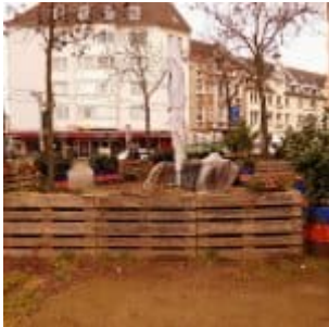
Terrasse der Bar Kausal