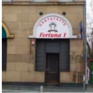
Gaststätte Fortuna 1