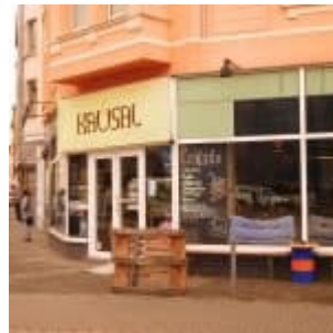
Das Kausal an der Ecke