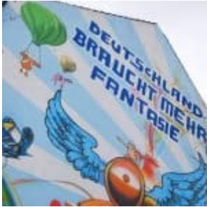
Fantasie an der Bahnunterführung