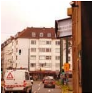
Ohne Sky TV