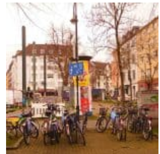
Dorotheenplatz - zugemüllt...