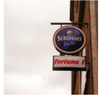
Fortuna 1, Schlösser alt