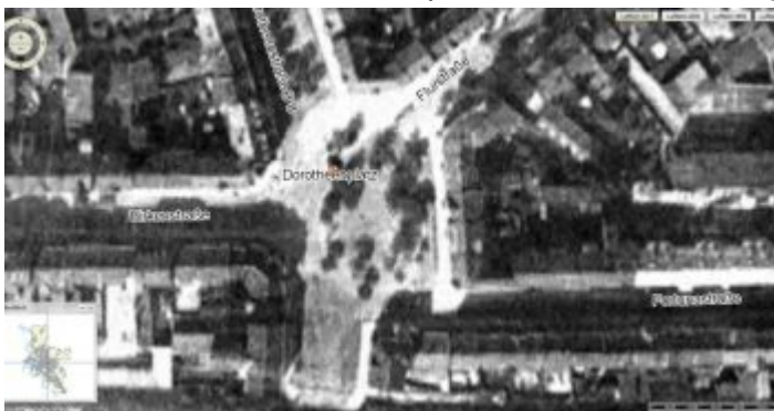
Der Dorotheenplatz 1927