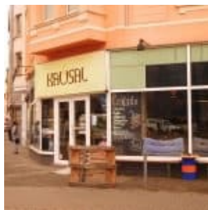
Das Kausal an der Ecke