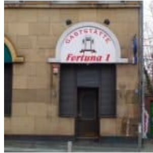
Gaststätte Fortuna 1