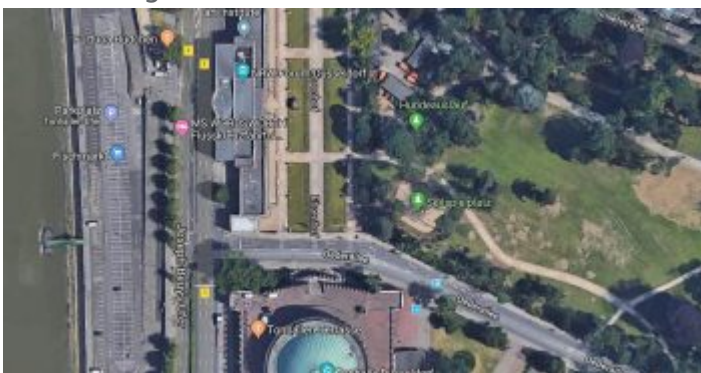
Der südliche Teil des Ehrenhofs mit Tonhalle

Zum Ehrenhof zählen zunächst die drei Flügel rund um den kreisrunden Brunnen, in denen der Düsseldorfer Kunstpalast mit seinen verschiedenen Abteilungen sowie der Robert-Schumann-Saal untergebracht sind. Nach Süden schließt sich ein länglicher Riegel an, in dem früher das Landesmuseum für Wirtschaft und Verkehr (Wirtschaftsmuseum) und heute das NRW Forum beheimatet war bzw. ist. Den Abschluss bildet die Tonhalle , in der bis in die Siebzigerjahre ein Planetarium existierte und die heute Düsseldorfs wichtigste Konzerthalle nicht nur für klassische Musik darstellt. Auch die Gartenanlage, die vom angrenzenden Hofgarten scharf getrennt ist, folgt in ihrer strengen Symmetrie und der messerscharfen Gestaltung von Beeten und Bäumen klassischen Vorbildern.