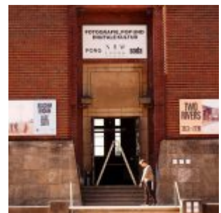
Eingang des NRW-Forums