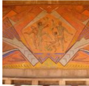
Mosaik im Torbau