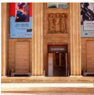
Eingang zum Kunstpalast