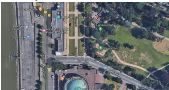
Der südliche Teil des Ehrenhofs mit Tonhalle

Zum Ehrenhof zählen zunächst die drei Flügel rund um den kreisrunden Brunnen, in denen der Düsseldorfer Kunstpalast mit seinen verschiedenen Abteilungen sowie der Robert-Schumann-Saal untergebracht sind. Nach Süden schließt sich ein länglicher Riegel an, in dem früher das Landesmuseum für Wirtschaft und Verkehr (Wirtschaftsmuseum) und heute das NRW Forum beheimatet war bzw. ist. Den Abschluss bildet die Tonhalle , in der bis in die Siebzigerjahre ein Planetarium existierte und die heute Düsseldorfs wichtigste Konzerthalle nicht nur für klassische Musik darstellt. Auch die Gartenanlage, die vom angrenzenden Hofgarten scharf getrennt ist, folgt in ihrer strengen Symmetrie und der messerscharfen Gestaltung von Beeten und Bäumen klassischen Vorbildern.