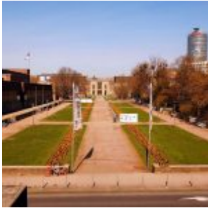
Der Ehrenhof von der Tonhalle aus gesehen