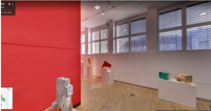
Der Kunstpalast ist eines der wenigen Gebäude der Stadt, bei dem man sich per Google Streetview virtuell durch die Räume bewegen kann

Zum Ehrenhof zählen zunächst die drei Flügel rund um den kreisrunden Brunnen, in denen der Düsseldorfer Kunstpalast mit seinen verschiedenen Abteilungen sowie der Robert-Schumann-Saal untergebracht sind. Nach Süden schließt sich ein länglicher Riegel an, in dem früher das Landesmuseum für Wirtschaft und Verkehr (Wirtschaftsmuseum) und heute das NRW Forum beheimatet war bzw. ist. Den Abschluss bildet die Tonhalle , in der bis in die Siebzigerjahre ein Planetarium existierte und die heute Düsseldorfs wichtigste Konzerthalle nicht nur für klassische Musik darstellt. Auch die Gartenanlage, die vom angrenzenden Hofgarten scharf getrennt ist, folgt in ihrer strengen Symmetrie und der messerscharfen Gestaltung von Beeten und Bäumen klassischen Vorbildern.