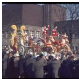
Dä Zoch am Ehrenhof (ca. 1964)

Bis in die Achtzigerjahre fanden in diesem einzigartigen Ensemble oft Live-Konzerte statt. Die Bühne wurde am Nordende aufgebaut. Der Eintritt war frei. Dann protestierten Anwohner gegen die Lärmbelästigung, und die Musik an diesem schönen Ort war aus. Bis sich im am 1. Juli 2017 die Düsseldorfer Gruppe Kraftwerk dort anlässlich des Grand Depart der Tour de France die Ehre gab. Dieses Mal stand die Bühne unterhalb der Tondhalle, und wer die Erfinder einer neuen Popmusik hören und sehen wollte, musste Geld für eines der raren Tickets