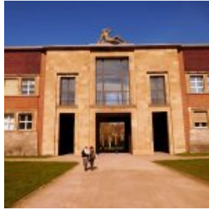
Der nördliche Eingang zum Ehrenhof