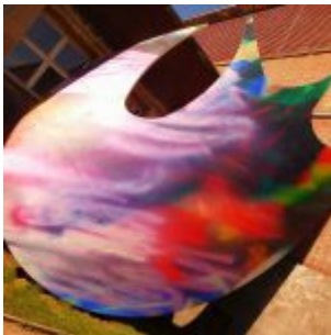
Kunst im Ehrenhof