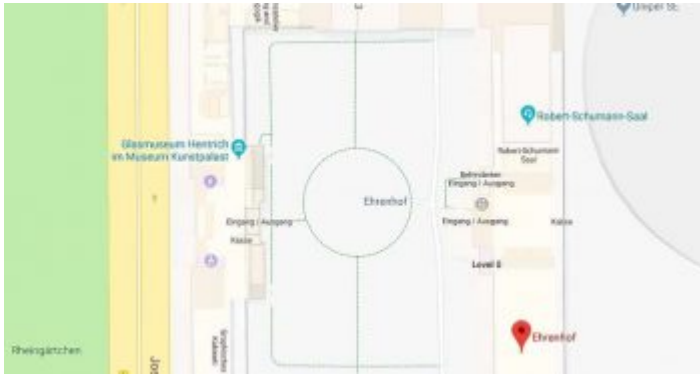
Der nördliche Teil des Ehrenhofs

ausgeben. Ob es je eine vergleichbare Veranstaltung im Ehrenhof geben wird, steht in den Sternen.