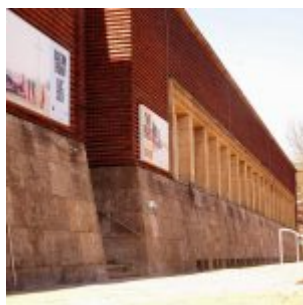
Front des NRW Forums, des ehemaligen Landesmuseum „Volk und Wirtschaft“