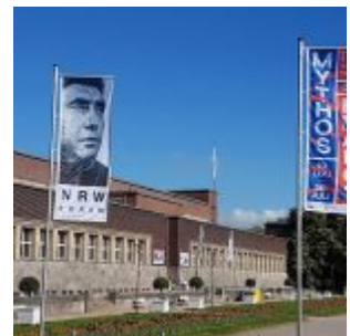
Das NRW Forum im Ehrenhof – mehr Pop als alles andere