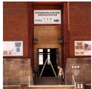
Eingang des NRW-Forums