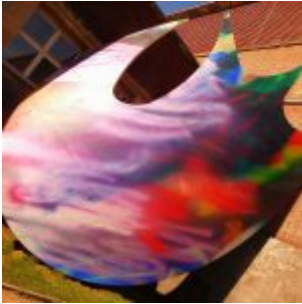
Kunst im Ehrenhof