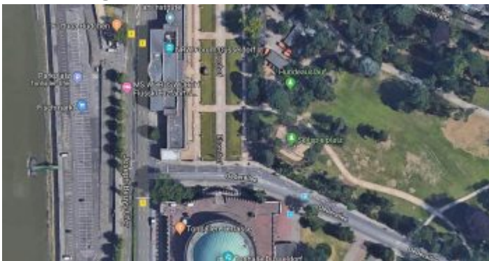
Der südliche Teil des Ehrenhofs mit Tonhalle

Zum Ehrenhof zählen zunächst die drei Flügel rund um den kreisrunden Brunnen, in denen der Düsseldorfer Kunstpalast mit seinen verschiedenen Abteilungen sowie der Robert-Schumann-Saal untergebracht sind. Nach Süden schließt sich ein länglicher Riegel an, in dem früher das Landesmuseum für Wirtschaft und Verkehr (Wirtschaftsmuseum) und heute das NRW Forum beheimatet war bzw. ist. Den Abschluss bildet die Tonhalle , in der bis in die Siebzigerjahre ein Planetarium existierte und die heute Düsseldorfs wichtigste Konzerthalle nicht nur für klassische Musik darstellt. Auch die Gartenanlage, die vom angrenzenden Hofgarten scharf getrennt ist, folgt in ihrer strengen Symmetrie und der messerscharfen Gestaltung von Beeten und Bäumen klassischen Vorbildern.