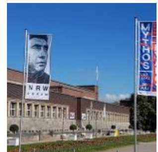
Das NRW Forum im Ehrenhof – mehr Pop als alles andere