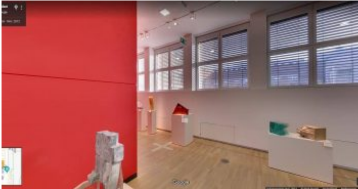
Der Kunstpalast ist eines der wenigen Gebäude der Stadt, bei dem man sich per Google Streetview virtuell durch die Räume bewegen kann

Zum Ehrenhof zählen zunächst die drei Flügel rund um den kreisrunden Brunnen, in denen der Düsseldorfer Kunstpalast mit seinen verschiedenen Abteilungen sowie der Robert-Schumann-Saal untergebracht sind. Nach Süden schließt sich ein länglicher Riegel an, in dem früher das Landesmuseum für Wirtschaft und Verkehr (Wirtschaftsmuseum) und heute das NRW Forum beheimatet war bzw. ist. Den Abschluss bildet die Tonhalle , in der bis in die Siebzigerjahre ein Planetarium existierte und die heute Düsseldorfs wichtigste Konzerthalle nicht nur für klassische Musik darstellt. Auch die Gartenanlage, die vom angrenzenden Hofgarten scharf getrennt ist, folgt in ihrer strengen Symmetrie und der messerscharfen Gestaltung von Beeten und Bäumen klassischen Vorbildern.