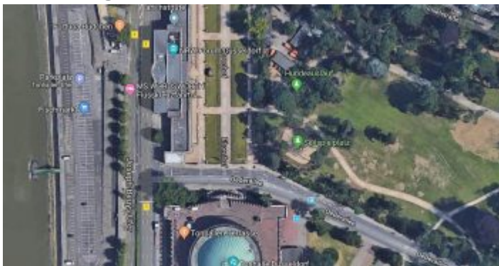
Der südliche Teil des Ehrenhofs mit Tonhalle

Zum Ehrenhof zählen zunächst die drei Flügel rund um den kreisrunden Brunnen, in denen der Düsseldorfer Kunstpalast mit seinen verschiedenen Abteilungen sowie der Robert-Schumann-Saal untergebracht sind. Nach Süden schließt sich ein länglicher Riegel an, in dem früher das Landesmuseum für Wirtschaft und Verkehr (Wirtschaftsmuseum) und heute das NRW Forum beheimatet war bzw. ist. Den Abschluss bildet die Tonhalle , in der bis in die Siebzigerjahre ein Planetarium existierte und die heute Düsseldorfs wichtigste Konzerthalle nicht nur für klassische Musik darstellt. Auch die Gartenanlage, die vom angrenzenden Hofgarten scharf getrennt ist, folgt in ihrer strengen Symmetrie und der messerscharfen Gestaltung von Beeten und Bäumen klassischen Vorbildern.