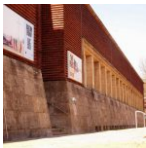
Front des NRW Forums, des ehemaligen Landesmuseum „Volk und Wirtschaft“