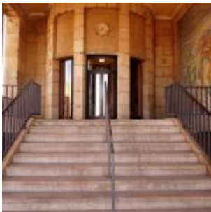
Nicht genutzter Eingang zur Tonhalle