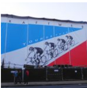
Kraftwerk im Ehrenhof – die Rückseite der Bühne