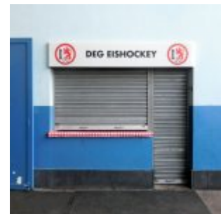
Das DEG-Büdchen (RB)

Keine Frage, das Eisstadion an der Brehmstraße ist ein magischer, ja, in mythischer Ort. Und das nicht nur wegen der großen Vergangenheit in Sachen Eishockey. Seit den frühen Sechzigerjahren ist das Eis am Zoo nämlich auch eine Stätte des Sozialverkehrs. Während der Laufzeiten probieren Jugendliche beiderlei Geschlechts ihre Reize aus, und wenn Eislaufer- und Eishockey-Eltern hinter der Bande ihre Brut anfeuern, dann kann man lernen, was Transfer von Ehrgeiz bedeutet. Verrückt genug, dass sich an diesen Ritualen in den vergangenen 50 Jahren kaum etwas verändert hat.