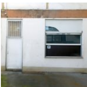
Die ehemalige Kreuzer-Pommesbude (RB)