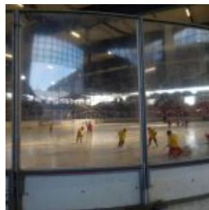
Im Eistempel trainieren immer noch die Bambini der DEG