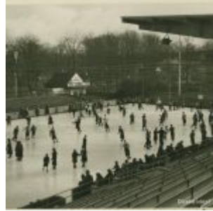
So sah das Eisstadion an der Brehmstraße ca. 1936 aus