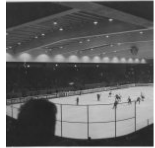
Ca. 1974