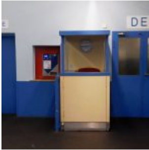
Blocks DEF und Kasse (RB)