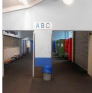
Blocks ABC und Umkleide (RB)