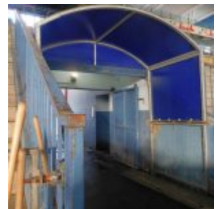
Der Spielertunnel (RB)