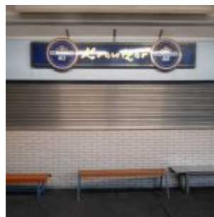
Ehemaliger Kreuzer-Bierbude (RB)