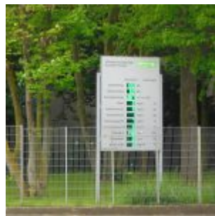
An der MVA