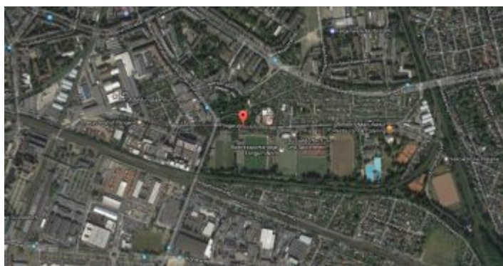
Google-Map: Flinger Broich

Betrachtet man den Flinger Broichs auf der Karte, erkennt man, dass eigentlich das langgestreckte Gebiet zwischen dem Hellweg im Norden und der Bahnlinie im Süden gemeint ist. Tatsächlich handelt es sich um eine Senke, die man sich gut als morastiges Sumpfgelände vorstellen kann. Die muss den Bauern vor einigen Hundert Jahren tierisch auf den Geist gegangen sein. Flingern war ein Dorf, von dem aus großflächig Felder bewirtschaftet wurden, so weit sich das Land urbar machen ließ, der Flingerer Bruch widersetzte sich also der Expansion.