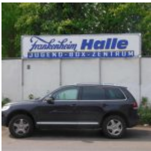
Einer der vielen Sponsoring-Dinge der Brauerei: Die Frankenheim-Halle des Jugend-Box-Zentrums am Flinger Broich