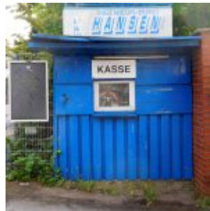
Kasse an der Boxhalle