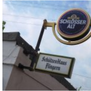
Früher Sportplatz, jetzt Schützenhaus