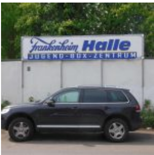
Einer der vielen Sponsoring-Dinge der Brauerei: Die Frankenheim-Halle des Jugend-Box-Zentrums am Flinger Broich