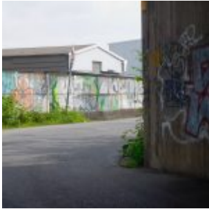
Flinger Broich: Das ist der Anfang