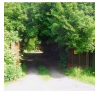
Weg zum Lagerplatz