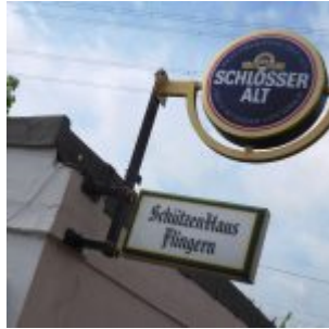
Früher Sportplatz, jetzt Schützenhaus