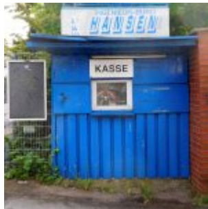
Kasse an der Boxhalle