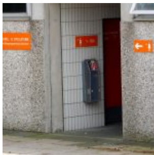
Füt Mutter und Baby