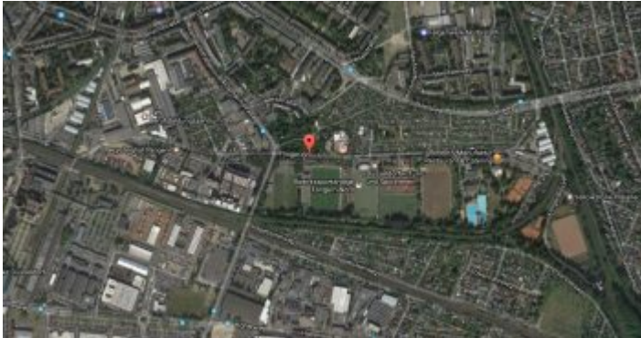
Google-Map: Flinger Broich

Betrachtet man den Flinger Broichs auf der Karte, erkennt man, dass eigentlich das langgestreckte Gebiet zwischen dem Hellweg im Norden und der Bahnlinie im Süden gemeint ist. Tatsächlich handelt es sich um eine Senke, die man sich gut als morastiges Sumpfgelände vorstellen kann. Die muss den Bauern vor einigen Hundert Jahren tierisch auf den Geist gegangen sein. Flingern war ein Dorf, von dem aus großflächig Felder bewirtschaftet wurden, so weit sich das Land urbar machen ließ, der Flingerer Bruch widersetzte sich also der Expansion.