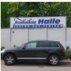
Einer der vielen Sponsoring- Dinge der Brauerei: Die Frankenheim-Halle des Jugend- Box-Zentrums am Flinger Broich