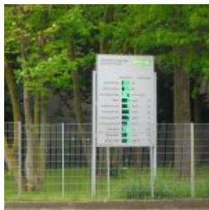
An der MVA