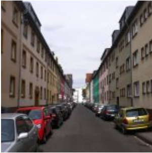
Blick durch die Füsilierstraße nach Osten