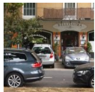
Restaurant Bellissima am Frankenplatz