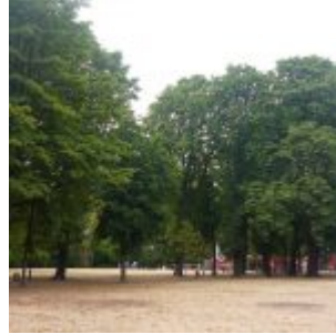
Die Wiese auf dem Frankenplatz