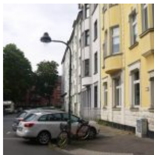
Blick entlang der Kanonierstraße