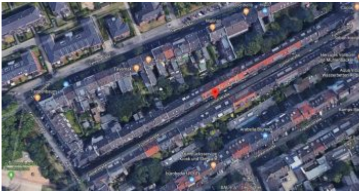
Google-Map: Füsilier- und Kanonierstraße am Frankenplatz