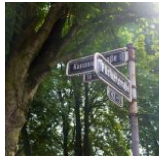
Die Kreuzung von Füsilier- und Kanonierstraße