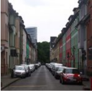
Blick in die Füsilierstraße von Osten