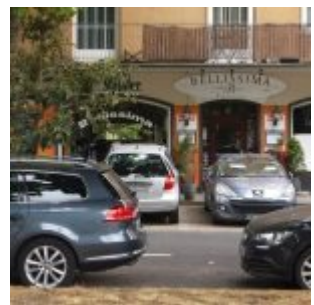
Restaurant Bellissima am Frankenplatz