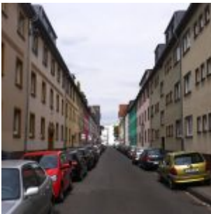
Blick durch die Füsilierstraße nach Osten