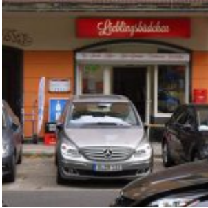
Das Lieblingsbüdchen a Frankenplatz