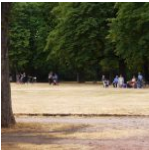
Der lichte Frankenplatz