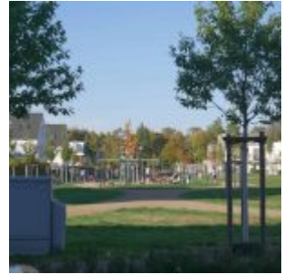
Ja, hier wohnen Menschen