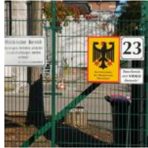
Oma und Opa auf dem Spielplatz Ein Stück Bundeswehr blieb

Wer schon länger in Düsseldorf lebt oder hier vor dem Beginn der Achtzigerjahre geboren ist, wird sich erinnern. Besonders natürlich die Jungs, die der Aufforderung der Bundeswehr folgten sich mustern zu lassen. Denn dann fuhren die Kerle mit mehr oder weniger gemischten Gefühlen Richtung Mörsenbroicher Ei und weiter, weil dort das Kreiswehrrersatzamt zu finden war. Links und rechts des eigentlich friedlichen Mörsenbroicher Wegs lag militärisches Sperrgebiet, südlich in Gestalt der Reitzenstein-Kaserne. Wie damals üblich, erblühten die Gebäude hinter starken Gittern in furchteinflößendem Feldgrau. Und während linkerhand noch heute Institutionen des Bundes hausen, hat man aus dem ehemaligen Kasernengelände ein Neubaugebiet gemacht – und sie nennen es „Gartenstadt Reitzenstein“.