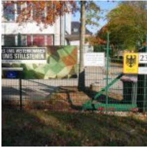
Ein Stück Bundeswehr blieb