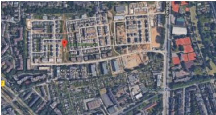
Google-Map: Gartenstadt Reitzenstein

Wer schon länger in Düsseldorf lebt oder hier vor dem Beginn der Achtzigerjahre geboren ist, wird sich erinnern. Besonders natürlich die Jungs, die der Aufforderung der Bundeswehr folgten sich mustern zu lassen. Denn dann fuhren die Kerle mit mehr oder weniger gemischten Gefühlen Richtung Mörsenbroicher Ei und weiter, weil dort das Kreiswehrrersatzamt zu finden war. Links und rechts des eigentlich friedlichen Mörsenbroicher Wegs lag militärisches Sperrgebiet, südlich in Gestalt der Reitzenstein-Kaserne. Wie damals üblich, erblühten die Gebäude hinter starken Gittern in furchteinflößendem Feldgrau. Und während linkerhand noch heute Institutionen des Bundes hausen, hat man aus dem ehemaligen Kasernengelände ein Neubaugebiet gemacht – und sie nennen es „Gartenstadt Reitzenstein“.