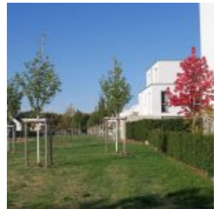
Garten im Anfangsstadium