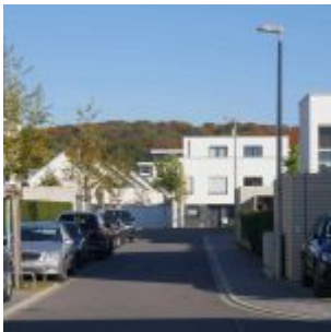
Blick zum Grafenberger Wald