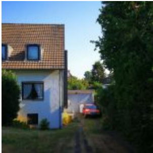
Benz im Garten