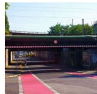
Ausgang: Dillenburger Weg

Kürzlich las ich in einem Forum für Neu-Düsseldorfer folgende Frage: Was ist denn das Gurkenland und wo ist es? Wer den Begriff in die Suche von Google-Maps eingibt, bekommt keinen schön eingerahmten Stadtteil, sondern nur den Hinweis auf die Werbung einer Tagesmutter. Eine nicht wirklich repräsentative Straßenbefragung ergab sogar, dass nur knapp ein Drittel der Menschen, die angaben Düsseldorfer zu sein, wussten, wo dieses ominöse Gurkenland liegt. Klären wir auf: Es handelt sich um ein ab 1959 erschlossenes, zuvor landwirtschaftlich genutztes Gebiet in einem Gleisdreieck zwischen Eller und Oberbilk.