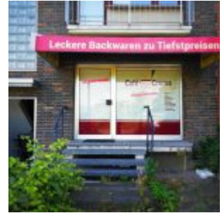
Cafe Cream - zu