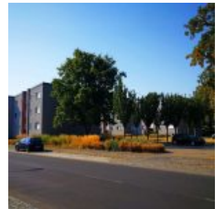
Am Seeheimer Weg im Gurkenland