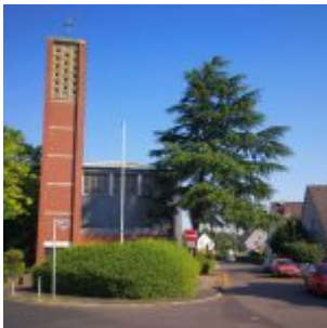
St. Pius X