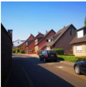
Der Wormser Weg im Gurkenland