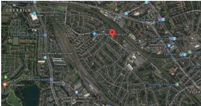
Google-Map: Gurkenland – mit dem Wormser Weg in der Mitte

Genauer gesagt: Das Gurkenland wird im Norden von der Karl-Geusen-Straße begrenzt, im Süden (ungefähr) von der Harffstraße, im Osten durch die Bahngleise Richtung Eller – Benrath – Köln und im Westen durch das ehemalige Rangiergelände mit dem Loksuppen am Ende. Im Norden gibt es nur einen Zugang: Aus Im Liefeld wird hinter der Unterführung beim Platz des SV Oberbilk der Seeheimer Weg. Aus östlicher Richtung führt der Dillenburger Weg ins Gurkenland, im Süden gibt es gleich drei Zugänge. Von der Siegburger Straße aus kommt man aber überhaupt nicht auf diesen fast unbekanntem Kontinent mitten in Düsseldorf.