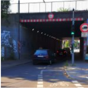
Eingang: Im Liefeld