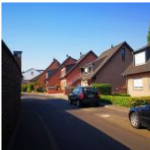
Der Wormser Weg im Gurkenland