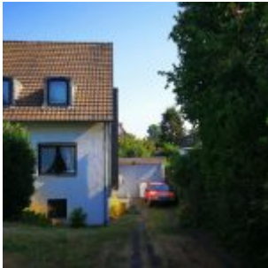
Benz im Garten