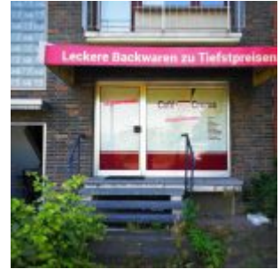
Cafe Cream - zu