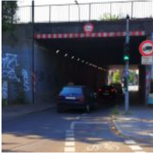
Eingang: Im Liefeld