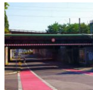
Ausgang: Dillenburger Weg

Kürzlich las ich in einem Forum für Neu-Düsseldorfer folgende Frage: Was ist denn das Gurkenland und wo ist es? Wer den Begriff in die Suche von Google-Maps eingibt, bekommt keinen schön eingerahmten Stadtteil, sondern nur den Hinweis auf die Werbung einer Tagesmutter. Eine nicht wirklich repräsentative Straßenbefragung ergab sogar, dass nur knapp ein Drittel der Menschen, die angaben Düsseldorfer zu sein, wussten, wo dieses ominöse Gurkenland liegt. Klären wir auf: Es handelt sich um ein ab 1959 erschlossenes, zuvor landwirtschaftlich genutztes Gebiet in einem Gleisdreieck zwischen Eller und Oberbilk.