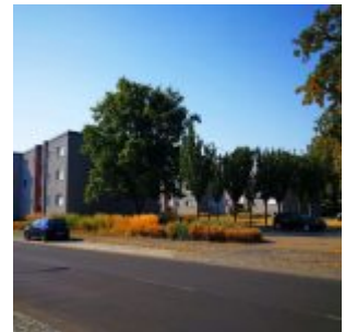
Am Seeheimer Weg im Gurkenland