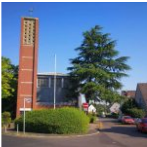
St. Pius X