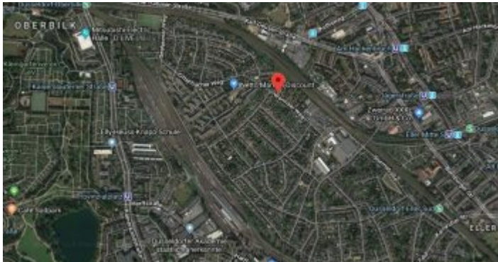
Google-Map: Gurkenland – mit dem Wormser Weg in der Mitte

Genauer gesagt: Das Gurkenland wird im Norden von der Karl-Geusen-Straße begrenzt, im Süden (ungefähr) von der Harffstraße, im Osten durch die Bahngleise Richtung Eller – Benrath – Köln und im Westen durch das ehemalige Rangiergelände mit dem Loksuppen am Ende. Im Norden gibt es nur einen Zugang: Aus Im Liefeld wird hinter der Unterführung beim Platz des SV Oberbilk der Seeheimer Weg. Aus östlicher Richtung führt der Dillenburger Weg ins Gurkenland, im Süden gibt es gleich drei Zugänge. Von der Siegburger Straße aus kommt man aber überhaupt nicht auf diesen fast unbekanntem Kontinent mitten in Düsseldorf.