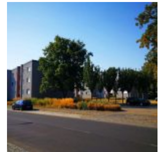
Am Seeheimer Weg im Gurkenland