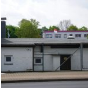
Hellweg Nr. 171