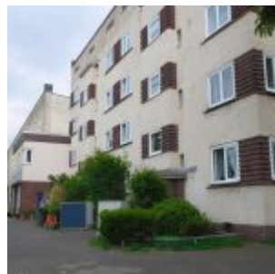
Die typischen Häuser