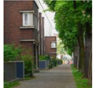
Die ungerade Seite