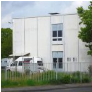
Das weiße Haus