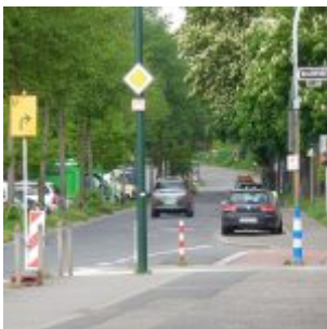
Einblick von Osten