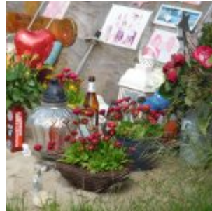
Gedenkstelle für Klaus