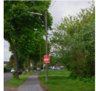
Der grüne Anfang