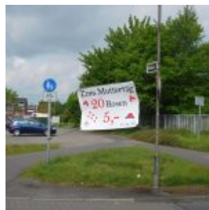
Wolle Rose kaufen?