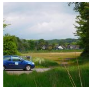
Blick über den Kirmesplatz