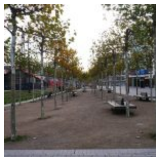
Die neue Platanenallee