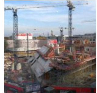
Das Ingenhoven-Tal als Teil des Kö-Bogen II