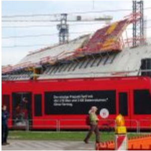
Ansicht der Großbaustelle