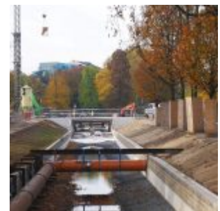
Die freigelegte Düssel