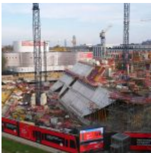
Blick auf den Nordrand des Tals