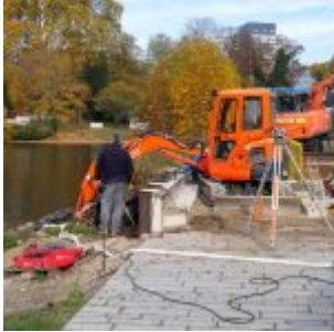
Die neue Düsselmündung

Eigentlich war die grundsätzliche Idee für das große Umgestaltungsprojekt, das heute allgemein als Kö-Bogen bekannt ist, nicht umstritten, nämlich den großen, hässlichen ÖPNV-Knotenpunkt namens Jan-Wellem-Platz verschwinden zu lassen, damit der Teil des Hofgartens, der Landskrone heißt, mit dem Corneliusplatz und der Kö zusammenwachsen könnte. Die Entscheidung für die Wehrhahnlinie hatte den Weg freigemacht, weil die gesamte Ost-West-Verbindung auf der Schiene durch die U-Bahn überflüssig wurde. Die Überlegung, das im städtischen Besitz befindliche Jan-Wellem-Platz-Grundstück sowie den Bereich zwischen Gustaf-Gründgens-Platz und Schadowstraße zu verkaufen, um so den U-Bahn-Bau teilweise zu refinanzieren, stammte dabei noch vom 2008 verstorbenen OB Joachim Erwin. Aber genau gegen diesen Verkauf regte sich massiver Widerstand in der Bevölkerung, der nur dadurch keine Auswirkung hatte, dass die zugehörige Bürgerbefragung das nötige Quorum nicht erreichte. Zunächst war das ganze Ausmaß des Umbaus auch so recht keinem Bürger bekannt oder bewusst.