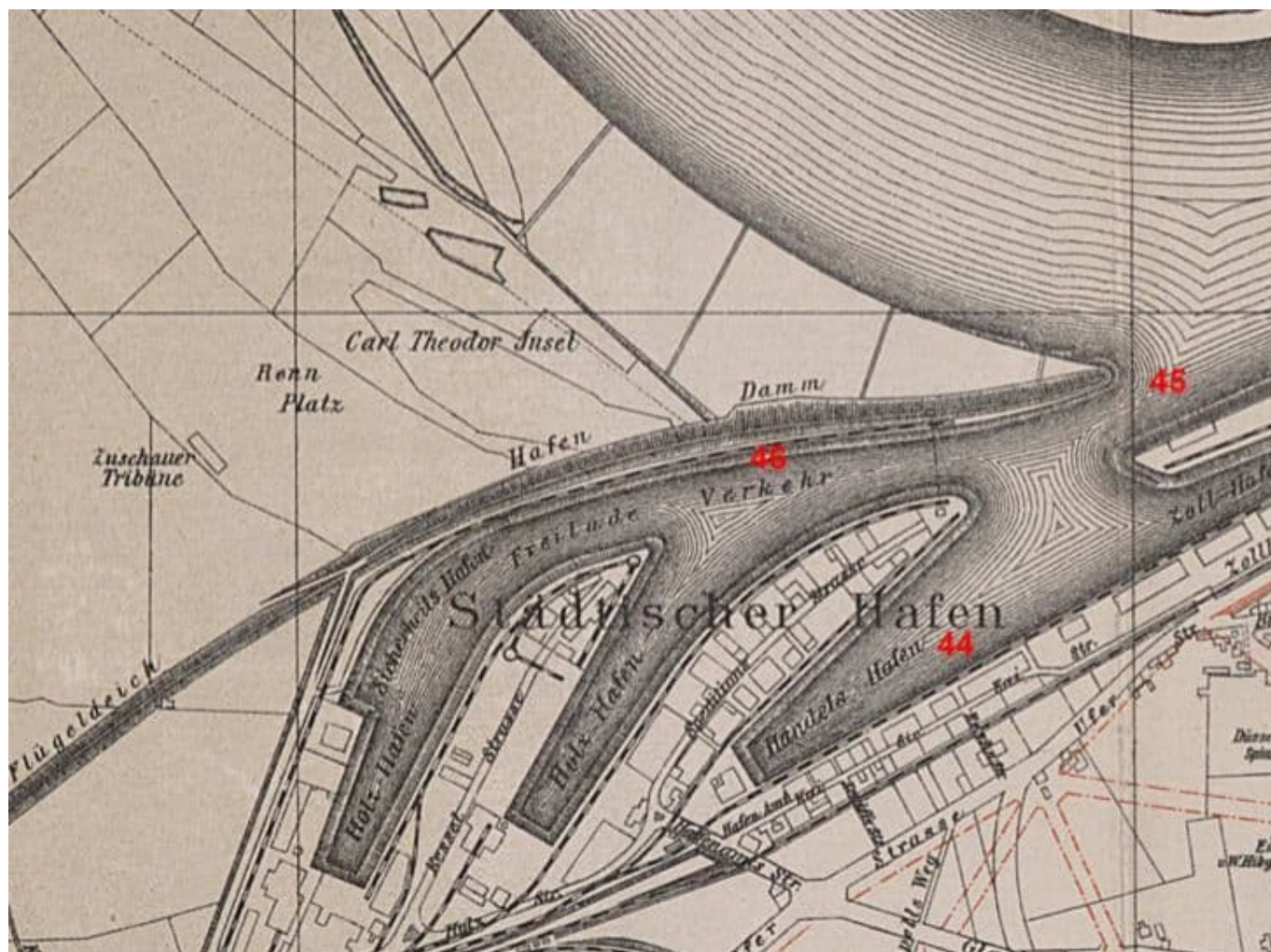
Die Carl-Theodor-Insel auf einer Karte von 1902

Bekanntlich war der Rhein bis zu seiner Begradigung und dem Umbau zur Wasserstraße im 19. Jahrhundert ein stark mäandernder Strom, der nördlich der engen Mittelrheintäler langsam durch flache Landschaften zog und sich dabei in etliche Arme teilte. Viele der Altrheinarme sind zwischen Köln und Duisburg noch gut erkennbar; die niederrheinische Auenlandschaft ist das Erbe des unzivilisierten Rheins. Wie lange genau die Lausward eine Insel war, ist kaum noch zu belegen – höchstens aber bis um 1815 herum, denn alle Karten der Region aus den Jahren danach zeigen keinen umfließenden Rheinarm mehr.