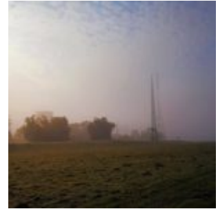
Die Lausward im Dunst