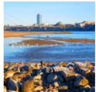
Vogelinsel auf der Lausward