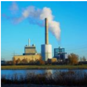
Kraftwerk Lausward in der Kälte