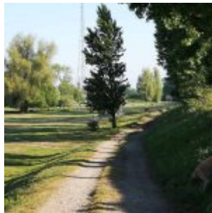
Weg auf der Lausward