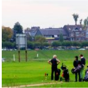
Golf auf der Lausward