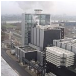
Blick auf den Block Fortuna des Kraftwerks auf der Lausward (Screenshot)