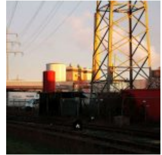
Am Kraftwerk Lausward