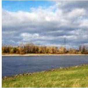
Blick von der Lausward