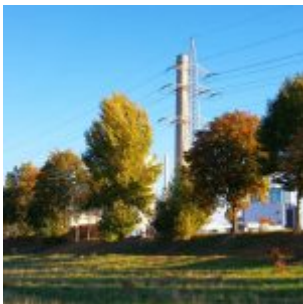
Auf der Lausward