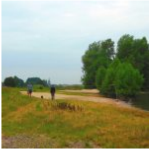
Der Paradiesstrand auf der Lausward