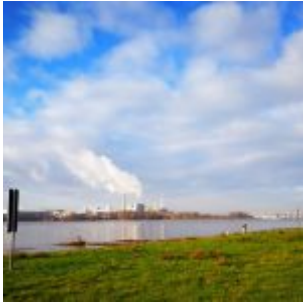
Blick auf die Lausward bei hohem Wasser