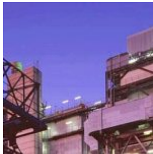
Kraftwerk Lausward anno 2012

Fragt man Neu-Düsseldorfer*innen, was die Lausward ist, erntet man meist ratloses Schweigen. Denn obwohl die ehemalige Carl-Theodor-Insel praktisch um die Ecke von Altstadt und Zentrum liegt, kennen viele dieses Idyll am Kraftwerk nicht – bestenfalls den Paradiesstrand unterhalb des Hafens und vielleicht auch noch den Golfplatz. Dabei handelt es sich um eine der schönsten und stillsten Ecken am Rhein auf Düsseldorfer Stadtgebiet. Über die Bedeutung des Namens gibt es mehrere Theorien, keine davon ist wirklich belegt. Im Grossen Düsseldorfer Lexikon heißt es schnöde, die Nachsilbe „werth“ stünde bekanntlich für „Insel“ und zusammen mit „lus“ wäre es eben eine Schilfinself gewesen. Nun ist die Annahme, „ward“ wäre eine Form von „werth“, einigermaßen abenteuerlich, denn im Rheinischen tragen Orte, die einst Flussinseln waren, durchweg die Silbe „werth“. Im Grimm’schen Wörterbuch aber finden wir den Begriff „Warde“, der „eine weidenpflanzung zur sicherung gegen das wasser in deichgegenden“ bedeutet. Und die „lus“ ist in allen älteren Formen des Hochdeutschen einfach die Laus. Könnte also sein, dass es sich um eine mit Weiden bepflanzte Insel voller (Blatt)Läuse gehandelt hat.