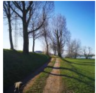
Morgens auf der Lausward