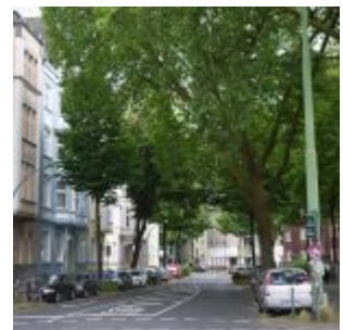
Von der Dorotheenstraße aus