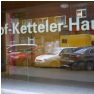
Gut katholisch allewege