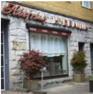
Unter falscher Flagge