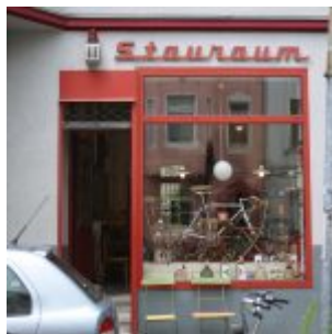
Kram für alle Lebenslagen