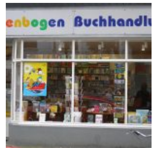
Geheimtipp für LeserInnen