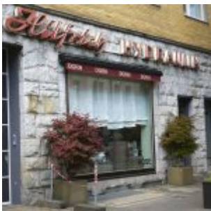
Unter falscher Flagge