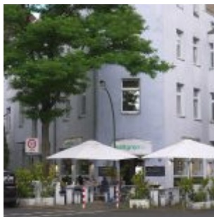
Sattgrün statt Taverna