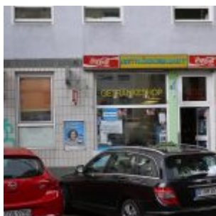
Das letzte echte Büdchen