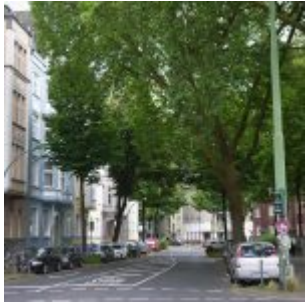
Von der Dorotheenstraße aus