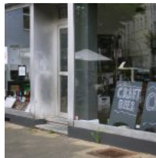
Natürlich Craft Beer...