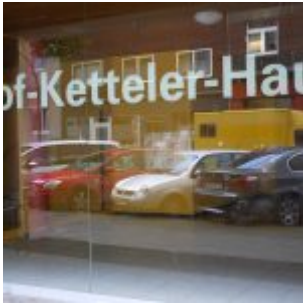
Gut katholisch allewege