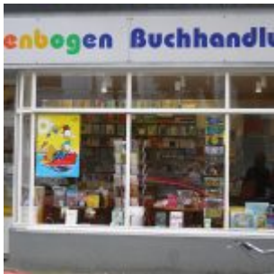
Geheimtipp für LeserInnen