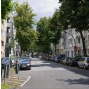
Vom Hermannplatz aus