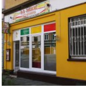
Das abessinische Restaurant