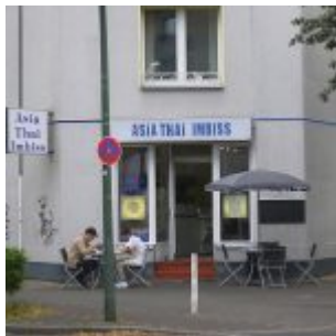
Kram für alle Lebenslagen