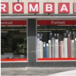
Wo's noch Teppichboden gibt...