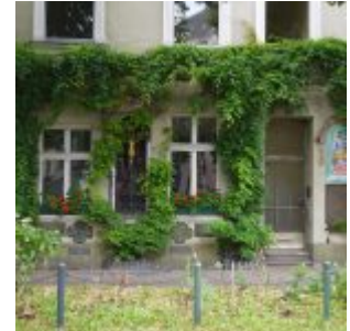
Das heilige Haus am Lindenplätzchen