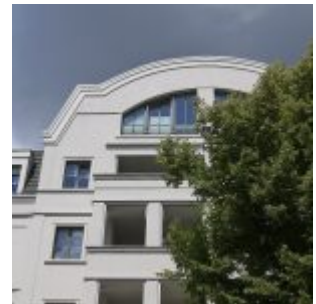
Statt Bunker - historisierender Luxus