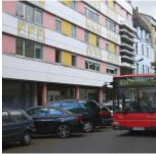
834 - der Linden-Express