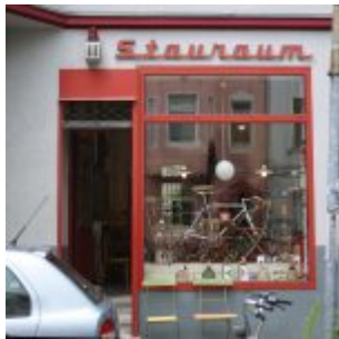
Kram für alle Lebenslagen