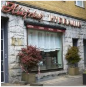
Unter falscher Flagge