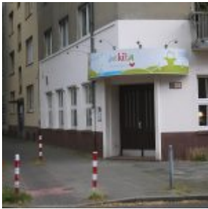
Unter falscher Flagge