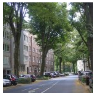
Von der Cranachstraße aus