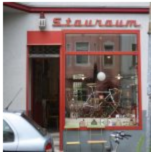
Kram für alle Lebenslagen