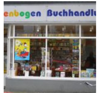
Geheimtipp für LeserInnen