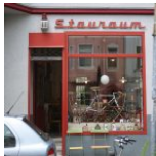
Kram für alle Lebenslagen