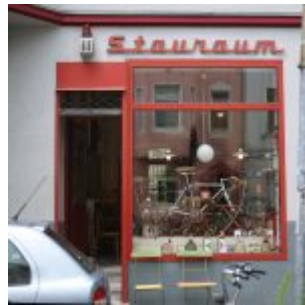
Kram für alle Lebenslagen