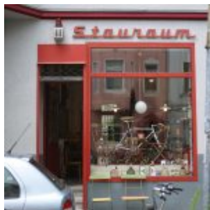
Kram für alle Lebenslagen