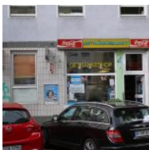
Das letzte echte Büdchen