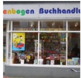
Geheimtipp für LeserInnen