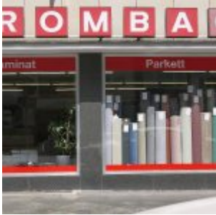
Wo's noch Teppichboden gibt...