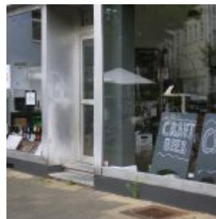
Natürlich Craft Beer...