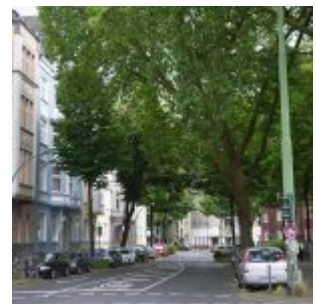
Von der Dorotheenstraße aus