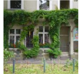
Das heilige Haus am Lindenplätzchen