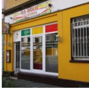
Das abessinische Restaurant