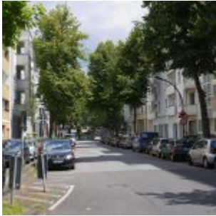
Vom Hermannplatz aus