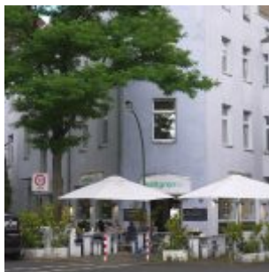
Sattgrün statt Taverna