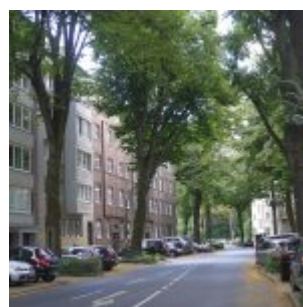
Von der Cranachstraße aus