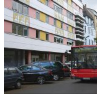
834 - der Linden-Express