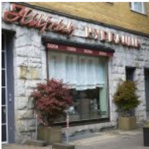
Unter falscher Flagge