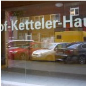
Gut katholisch allewege