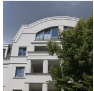
Statt Bunker - historisierender Luxus