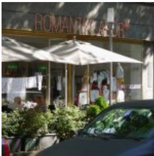
Sehr schick: das Romantiklabor