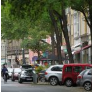
Blick in Richtung Bilker Kirche