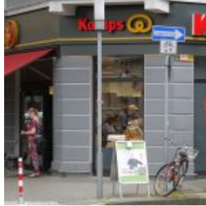
Schon immer an der Ecke, der Supermarkt