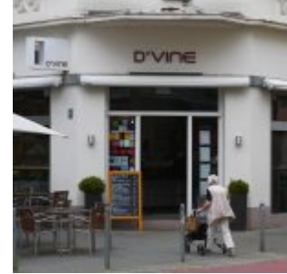
D'Vine, ein angesagtes und hochgelobtes Restaurant