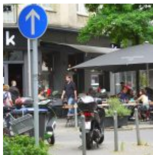
Eine der vielen Gastronomie-Terrassen