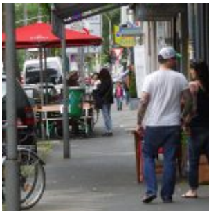
Passanten auf der Straße