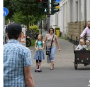
Ein Viertel für Lastenräder