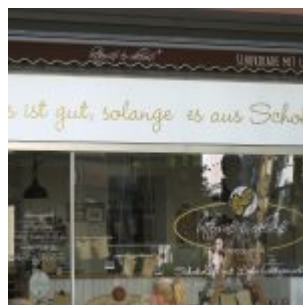
...solange es Schokolade ist.