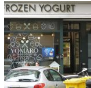
Yomaro - mit Qualität den Hype überlebt