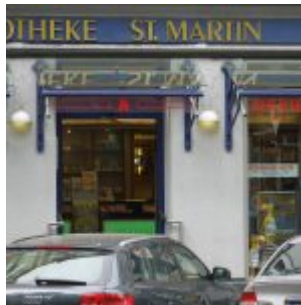
Schon immer da, die St.Martin-Apotheke