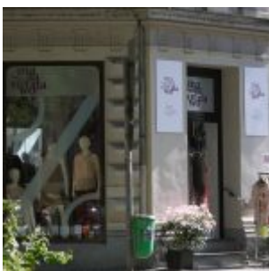
Absolut stilsicher: das magasin dawo