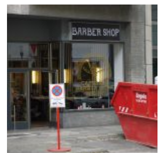
Hip und cool: ein Barber-Shop