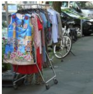
Mode auf dem Gehsteig