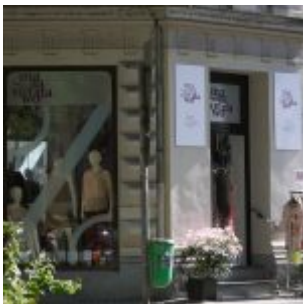
Absolut stilsicher: das magasin dawo