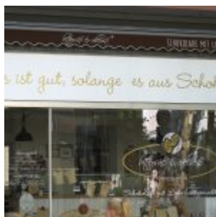
...solange es Schokolade ist.