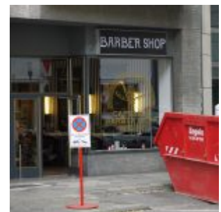
Hip und cool: ein Barber-Shop