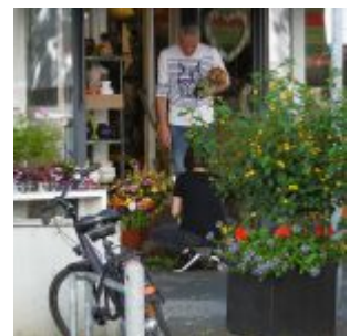
Blumenschmuck für feine Leute