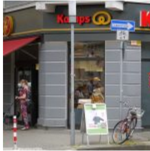
Schon immer an der Ecke, der Supermarkt