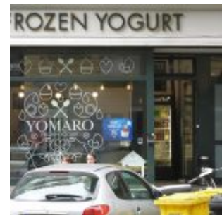
Yomaro - mit Qualität den Hype überlebt