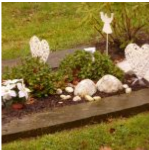
Kitsch auf dem Grab