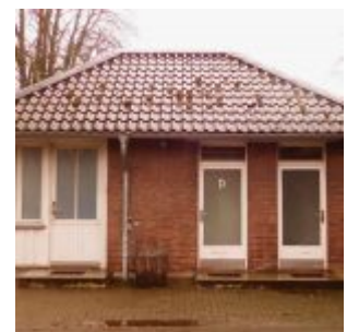
Eingang mit Damentoilette