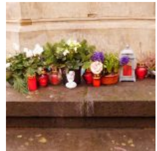
Lichter und Blumen