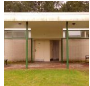
Unterstand mit Herrentoilette