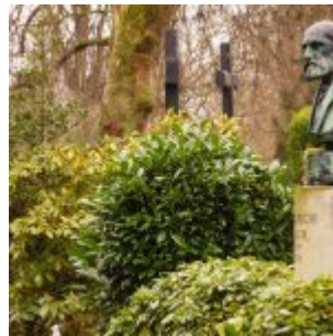
Das Haupt über dem Grab