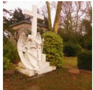
Egel mit Kreuz