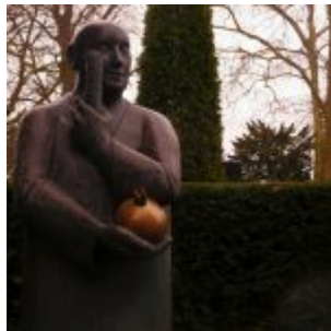
Skulptur mit Goldball