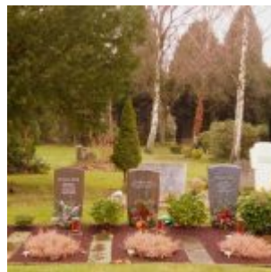
Reih und Glied