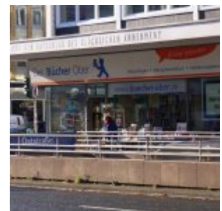
Lesen schadet der Dummheit - Buchladen Ober