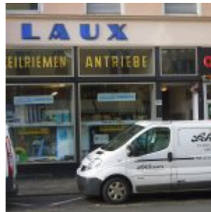
Schon immer da: Laux