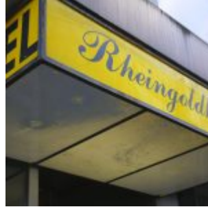
Rheingold-Hotel, neben McD