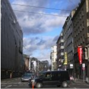
Oststraße – alte Landstraße im Wandel