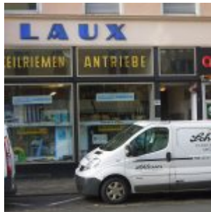
Schon immer da: Laux