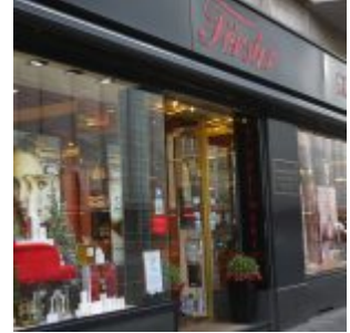
Parfümerie Förster – ein echter Familienbetrieb