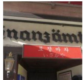
Traditionskneipe, jetzt koreanisch