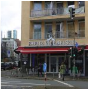
Faroz Meerfisch – neues Highlight