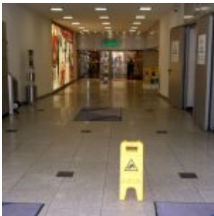
Kaufhof - die Rückseite