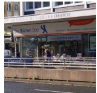
Lesen schadet der Dummheit - Buchladen Ober