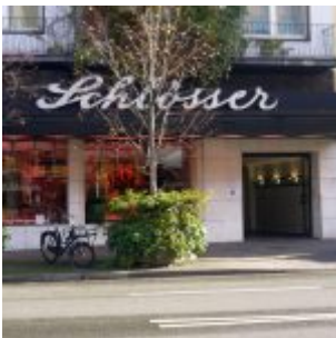
Die Metzgerei Schlösser auf der Oststraße