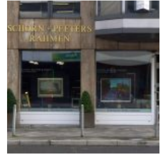
Letzter Mohikaner - das Rahmengeschäft