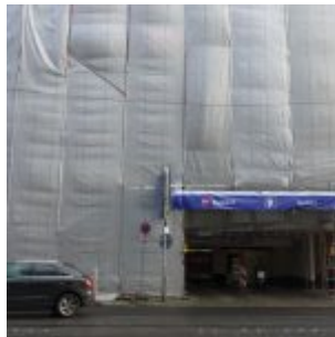
Abriss, Umbau, Neubau