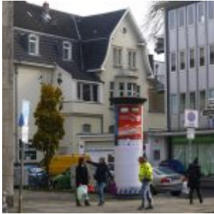
Blick in die Leopoldstraße