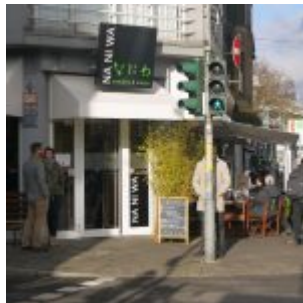
Schon ewig hier: Nudelrestaurant Na Ni Wa