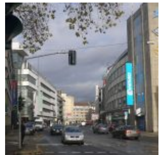
Das obere Ende der Oststraße