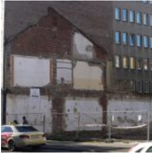
Schatten eines Hauses