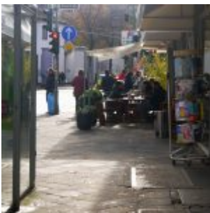
Draußen esse bei 6°