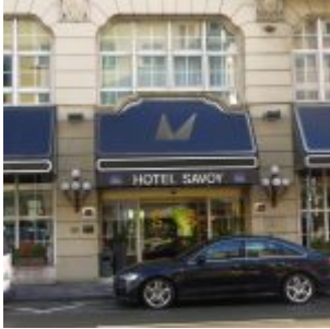
Das Hotel Savoy