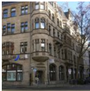
Das ehemalige Finanzamt an der Ecke Stresemannstraße