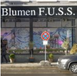
Eine Legende - Blumen Fuss