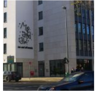
Ganz neu, ganz normal