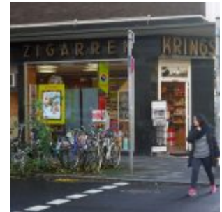
Schon immer da: Zigarren Krings