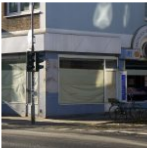
Leerstand bei Briefmarken und Münzen