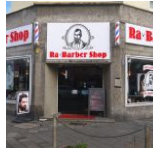
Boll im Trend: RaBarber