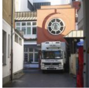
Hof der Brauerei Ferd. Schumacher