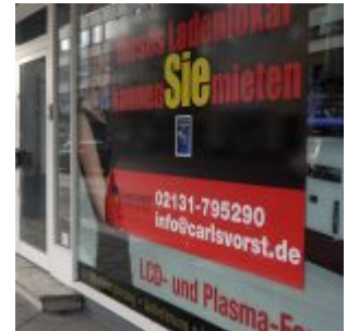
Sie können Mieten