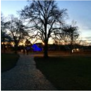
Blaue Nessi am TuRU-Platz